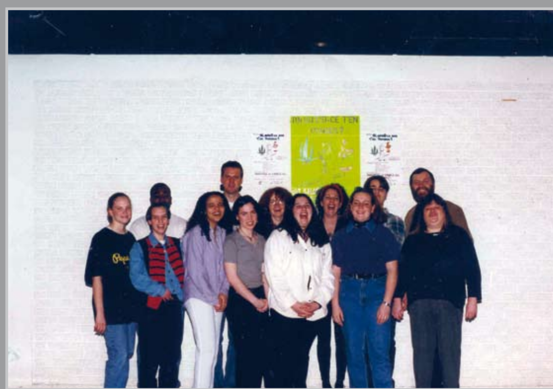
Projet "Prévention toxico" en collaboration avec le CLSC